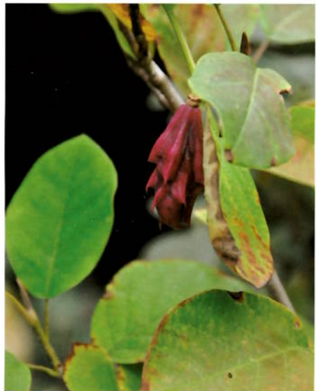
Magnolia sieboldii med frukt 7. oktober

Enkianthus campanulatus 'Red Velvet' står helt inn til terrassen, så vi virkelig kan nyte den og dens vekst hele året. Klokketrolleyng er en plante jeg virkelig har prøvd mange ganger, men med døden til følge! Denne 'Red Velvet' er