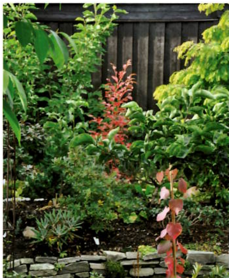
Utsikten fra spisebordet 6. oktober