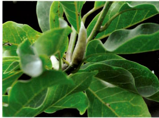
Magnolia 'Heaven Scent' 7. oktober

veldig sent i år, men det er bare å nyte det som er å nyte.