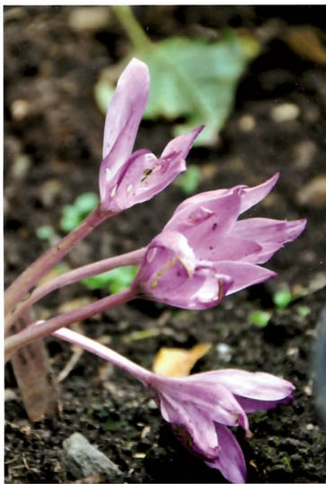
Over: Cochicum speciosum , 7. okt.