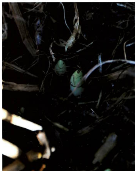
Cypripedium 'Gisela' 11. oktober

Håper dette kan inspirere dere til å gå ut i hagen deres og nyte det som nytes kan!