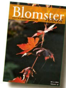
Acer palmatum 'Trompenburg'