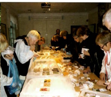
Blomstervenner på løkjakt