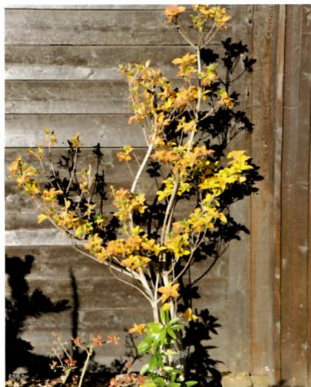
Enkianthus campanulatus 'Red Velvet' 11. okt.