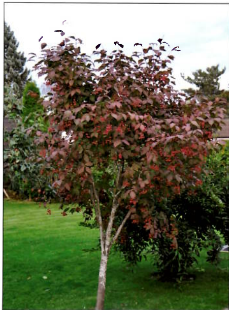
Euonymus sachalinensis 16. september

Bladene på Euonymus sachalinensis fikk mer og mer glød og ga sammen med fruktene et fantas-