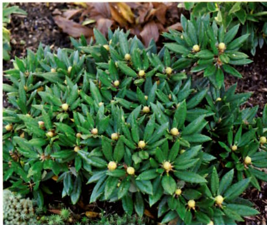
Rhododendron pseudochrysanthum 30. sept.

naturen selv, her Rhododendron pachysanthum med både blomsterknopp og bladknopp.