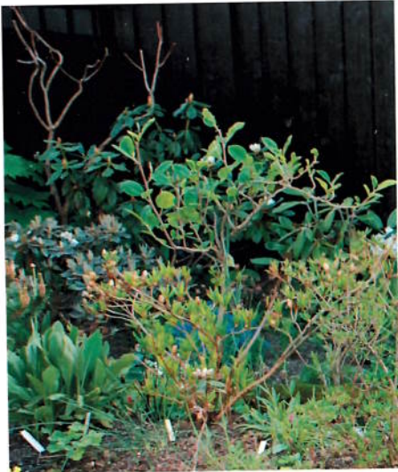
Rhododendron fortunei mai 2010, Magnolia sieboldii 'Hammarö' i forgrunnen.

marö', som klarte vinteren uten en død kvist, og den er begynt å blomstre for første gang i år, selv om det ble litt sent – slutten av august! Magnoliaer var altså også et sorgens kapittel i vår, men de aller fleste kom etter hvert – men mye seinere enn vanlig – i gang med å bryte og begynne veksten. Magnolia liliiflora 'Nigra' er en plante jeg har hatt i mange år, og som jeg ikke hadde lyst til å miste. Den sto og sturet lenge, ingen blomsterknopper hadde klart seg, men heldigvis kom den seg gjennom krisen og satte i gang med å vokse og kom også med en enkelt blomst langt ut på sommeren. Magnolia stellata 'Keskei' klarte å skyte noen små enkelte skudd, men de pak-