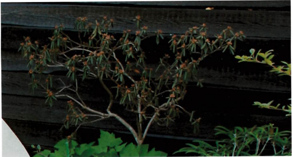
Rhododendron 'P.J.Meziit' ved å dø.

ke mye brunsvidde blader, noen var til og med helt brune. Litt mer optimisme med hensyn til de småbladede dverg rhododendronene som så tilnærmet friske ut. Barlind hadde ganske mye brunsvidde partier, min Taxus baccata 'Fastigiata' var brun og død på den øverste delen – ca. 75 centimeter måtte jeg klippe bort. Men som dagene gikk, ble de fleste dverg rhododendronene mer og mer brune til tross for at de hadde stått godt beskyttet under snøen. Magnoliaene var utrolig sene om å komme i gang med løvspring, knoppene var blitt ødelagt av vinteren, ja det var virkelig mange bekymringer og tanker forbundet med plantenes