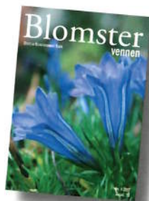
FOTO: Gentiana 'Blue Silk'