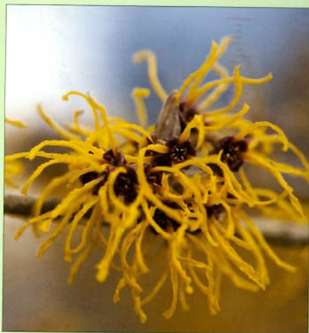
Hamamelis x intermedia 'Nymans'.

Jeg vil slå et slag for de mange hybridtrollhassel-sortene som finnes. De har hatt ord på seg for å være lite herdige (H2-3), men det viser seg at de overvintrer og blomstrer godt i hager i H4-H5. Dessverre havner de nesten utelukkende i hager til kjennere, fordi de blomstrer før folk begynner å