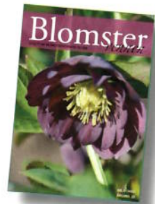
Helleborus orientalis Hillier Hybrid