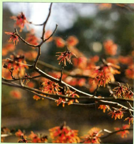
Hamamelis x intermedia 'Feuerzauber'.