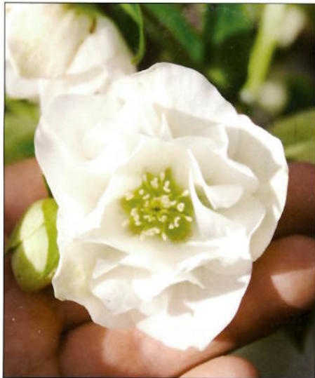
Under og til høyre: Diverse former av hybridjulerose.

tenkelige farger, utenom blått. Både enkle, halvfylte og fylte former finnes, med og uten prikker. Mitt råd er: Velg de mest fargesterke og de med renest farge. Nye frøsorter utvikles hele tiden og fargene blir bare bedre og bedre. De er kanskje de enkleste julerosene å få til og trives nesten overalt utenom den varmeste sydveggen. De selvsår seg ellevilt i hagen, og frøplanter må flyttes bort i massevis hvert år. Siden de krysser seg med alle juleroser som er i nærheten, tar du vare på frøplantene for å se hvilken blomsterform og farge de nye plantene får.