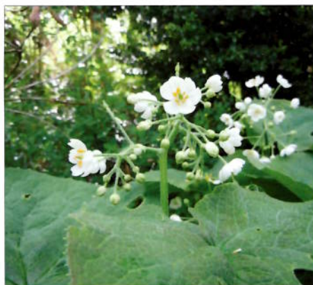
Diphylleia sinensis blomst.