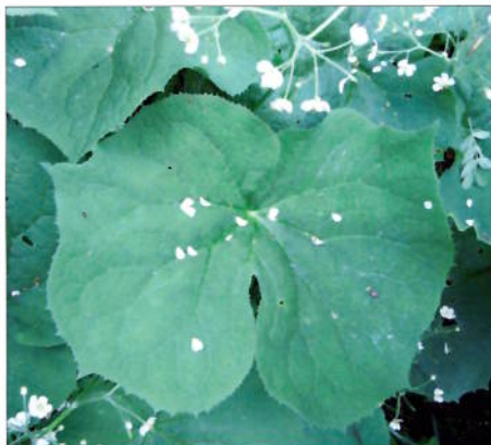
Diphylleia sinensis bladverk.