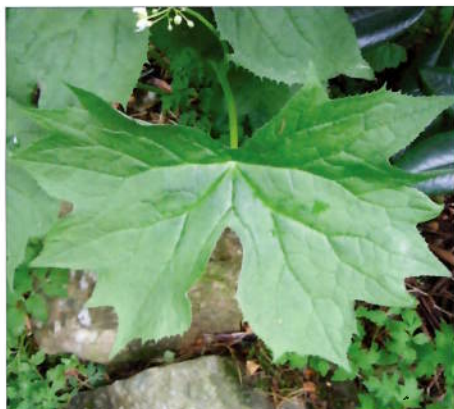
Diphylleia cymosa bladverk.