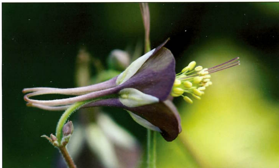
Aquilegia viridiflora

Har du lyst til å overta frølisten for 2012, ta kontakt med styreleder Signe Videm på tlf. 992 71 947, eventuelt Tommy Tønsberg på 952 56 300.