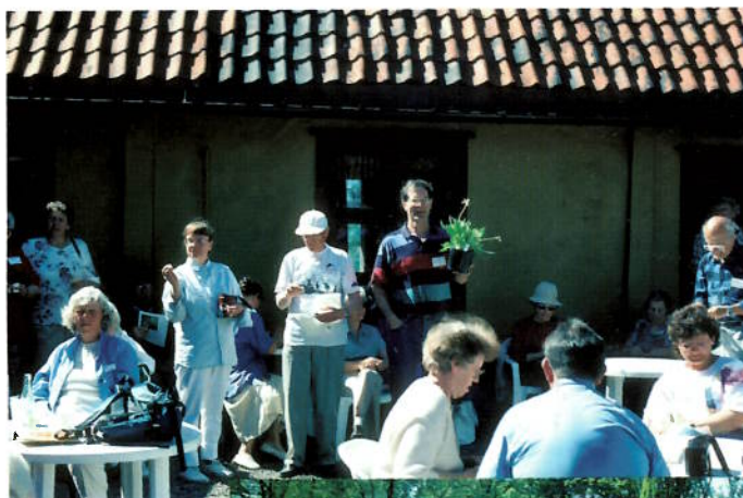
Jubileet 1994.