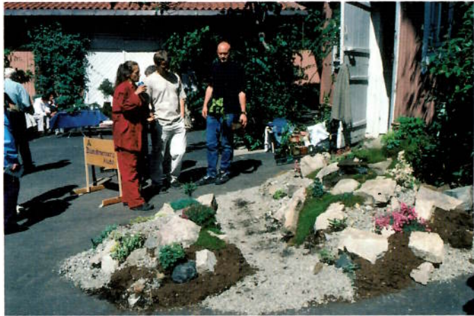
Blomstervernens klubbs fjellhage på Vårtreffet 2000.

Blomstervernens Klubb har siden 1993 deltatt sammen med en rekke andre «grønne» foreninger. Klubbens hensikt er på denne måten å vise frem spesielle planter, og ivrige styremedlemmer har laget små hagepartier for å vise publikum hva man kan få til.