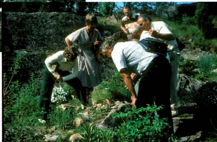
Hva i all verden har vi her?