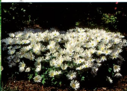
Frodighet i Ragnars hage.