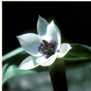
Tulipa humilis 'Alba Coerulea Oculata'.