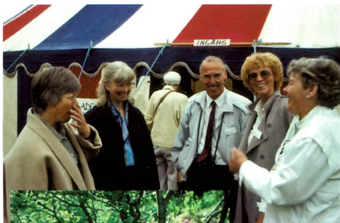
Glade blomstervenner.