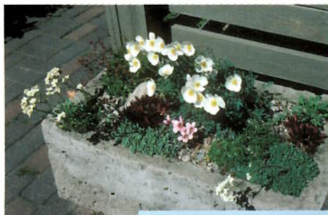
Også et trau er en liten hage.

I årene 1974 til 1992 gikk det nesten hvert år fellesreiser til STAs riksmøter med besøk i vakre og inter-