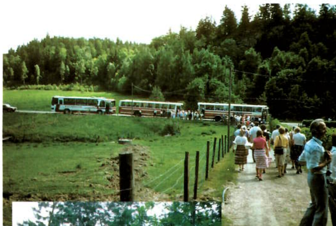
Endeløs deltagerrekke på hagebesøk med Trädgårdsamatörerna.