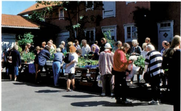
Plantebyttemøte i Botanisk hage på Tøyen.

I dette avsnittet har vi vist hvor vanskelig det har vært å utvikle et mangfoldig plantelivet i hagene. Men vi ser at det langsomt glir fremover, og ikke minst at Blomstervenner selv vil formidle kunnskaper og gleder og ikke lar seg kue i sin optimistiske trang til utvikling og dermed bidra til større hageglede allment sett.