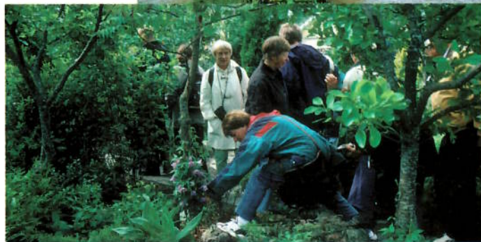
Østfold-turen 2000.