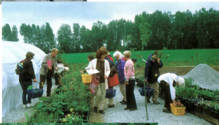
Plantekjøp hos Borgny.