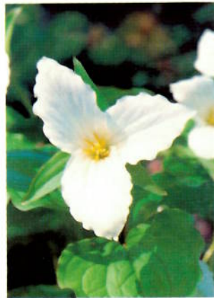
Trillium grandiflorum .

I 1993 ble det forut for 40-årsjubileet 1994 utlyst en fotokonkurransen med oppgitt motiv: Trillium , Lilium og Paeonia . Tanken var å lage brevkort. Trillium -bildet ble vunnet av Sverre Nordnes, og det er det kortet som fremdeles er til salgs. Han fikk også premie for sitt bilde av Paeonia peregrina . Lilium -bildet ble vunnet av Liv Horn, og medlemmenes valg falt på: Liv Horns bilde av Phacelia campanulata .